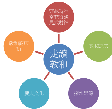
圖 2 走讀敦和課程心智圖雛形

課程，重在「敦和商店街」方面；行政決定以「廣達游於藝展」融入其中，發想出-「跨越時空-當梵谷遇見武財神」，低年級將社區踏查大榕樹與北投水圳結合，發想出-「探水思源」；中年級學校處處都是美發想出-「敦和之美」；科任老師討論出，以敦和宮的慶典文化與學生生活息息相關，發想-「慶典文化」。校訂課程「走讀敦和」課程心智圖雛形如圖 2 所示。