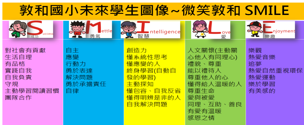
圖 1 校訂課程學校願景及學生未來圖像

其次，學校教師在分組討論下從 S（成功）、M（勇氣）、I（智慧）、L（愛）、E（樂趣）五個面向討論出學生圖像如（圖 1）所示。教授提示，這個圖像是老師希望的圖像，還是學生本身未來的圖像。經過專業對話提問，從眾多便利貼中再次對話省思，重新排序解釋再聚焦，「在 S 成功方面，學生整體上對社會有貢獻」、「在 M 勇氣方面，學生能自主」、「在 I 智慧方面，學生有創造力」、「在 L 愛方面，學生有人文關懷精神」、「在 E 樂趣方面，學生樂觀」。