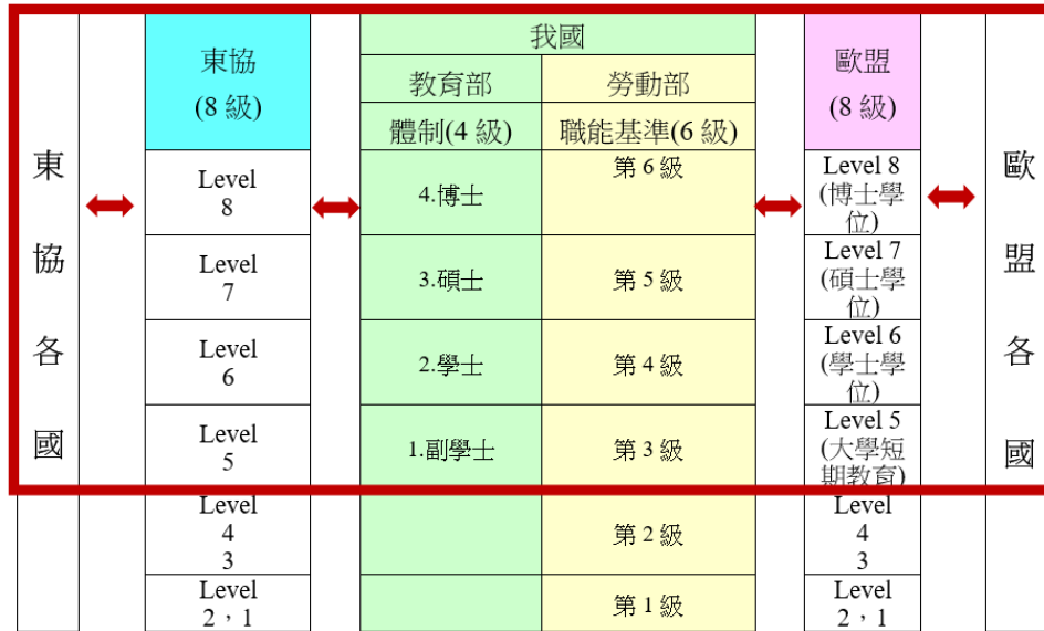
圖 3 我國高等教育學資歷與國際銜接可行性之架構雛型

本研究透過研究結果分析與討論，茲提出我國高等教育資歷架構雛型，分為四層級，整合高等教育副學士以上學位及勞動職能基準第三至第六層級，對應歐盟與東協資歷架構第五至第八層級，可擴及銜接歐盟與東協等各國國家資歷架構，如圖 3 所示。