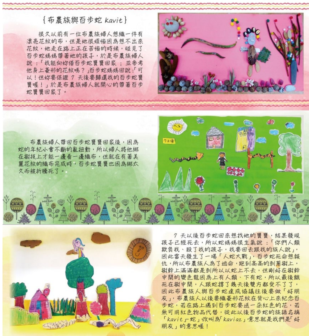
圖 1 美學實踐-幼兒根據布農傳說故事集體創作

幼兒在探索與覺察的過程中，運用體驗、歌唱、舞蹈、傳說故事暨踏察等各種視覺、聽覺、味覺、嗅覺及觸覺的藝術媒介來發揮想像，進行個人或團體獨特的表現與創作如（圖1）。