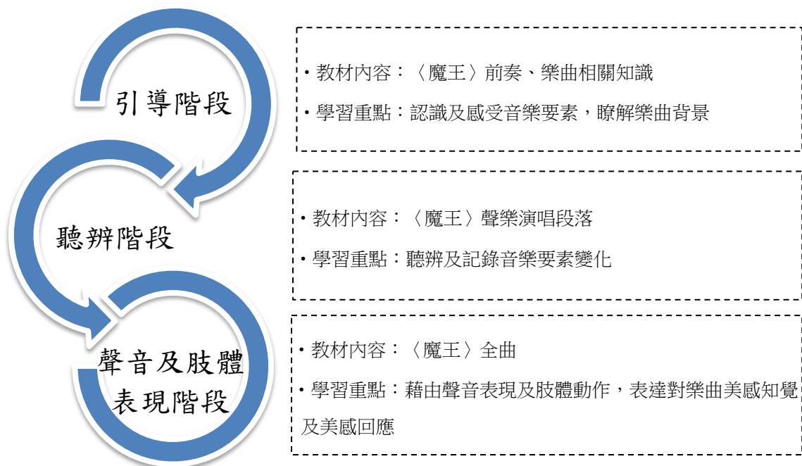
圖 2 〈魔王〉賞析與展演之課程架構

運用前述分析結果，研究者將課程分為三部分（見圖 2）：一是引導階段，以樂曲前奏為教材，引導學生認識及感受其中音樂要素的變化，並瞭解樂曲相關知識。第二階段為聽辨階段，以樂曲聲樂演唱部分為教材，學生分組選擇樂曲中的一個角色，在歌詞上記錄下其角色的音樂要素變化（如強、弱、高亢、低沉等）。第三階段為聲音及肢體回應階段，學生須透過說話聲音及肢體動作，以符合樂曲特色的方式表現出魔王歌詞。