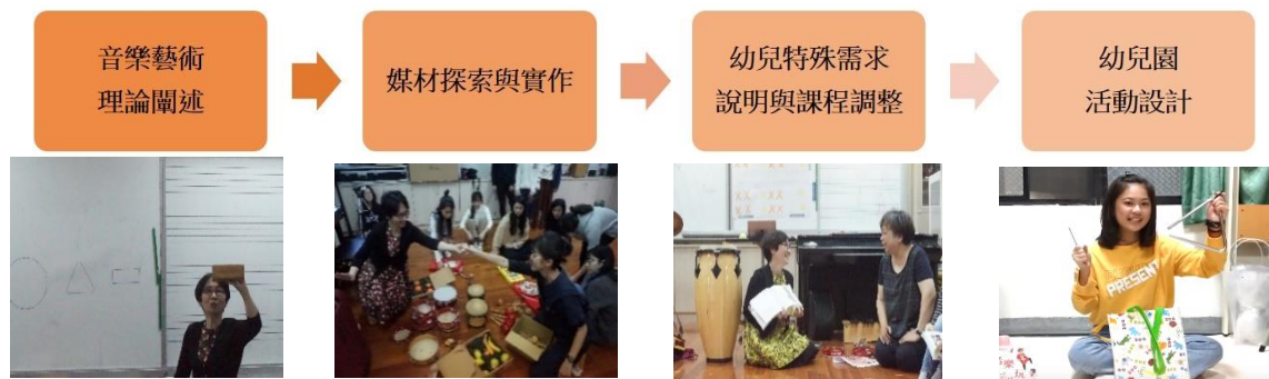
圖 2 音樂理論與實作

整體而言，師資生課程的設計從音樂理論的闡述，師資生樂器/藝術媒材的探索與實作，再將音樂元素融入幼兒園活動設計中，並配合「學前融合教育理論與實務」課程構思如何協助特殊需求幼兒參與課程，最後進行幼兒園教學活動設計的分析與討論等（見圖 2）。