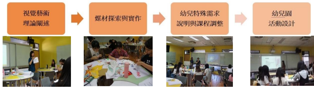
圖 1 視覺藝術理論與實作