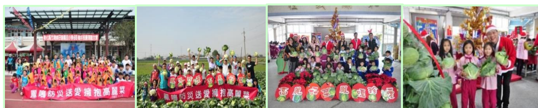
與偏鄉國小校際交流 帶孩子協助小農採收 溫馨聖誕節-高麗菜山 歡喜收禮物-高麗好菜