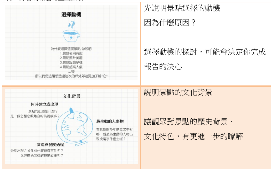
表 1 錄音簡報檔的畫面擷取

課程教學流程先以簡報檔的資料給學生觀看瞭解，分組選定畢旅的報告景點，課後時間的資料蒐集，課堂中各組的小組討論時間與教師說明內容，選定資料報告的呈現方式，例如：簡報 P P T 說明、海報呈現、新聞報導、雙人應答，最後經過排練與同儕之間的檢討與反思，最終上台分享。