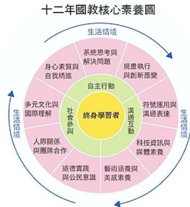
圖 1 十二年國教核心素養圖

課程綱要總綱裡所論及的核心素養，主要有三個面向，包括自主行動、溝通互動及社會參與。再據此發展出九項具體內涵，如圖 1。各領域及各學習階段皆以此三面九項內涵轉化其領域學習內容及學習表現，落實於課程及教學。