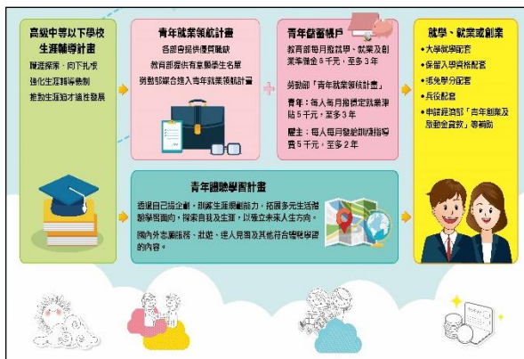
圖 2 青年教育與就業儲蓄帳戶方案具體架構圖