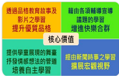
圖 2 Z 校午餐約會兒童廣播計畫核心價值