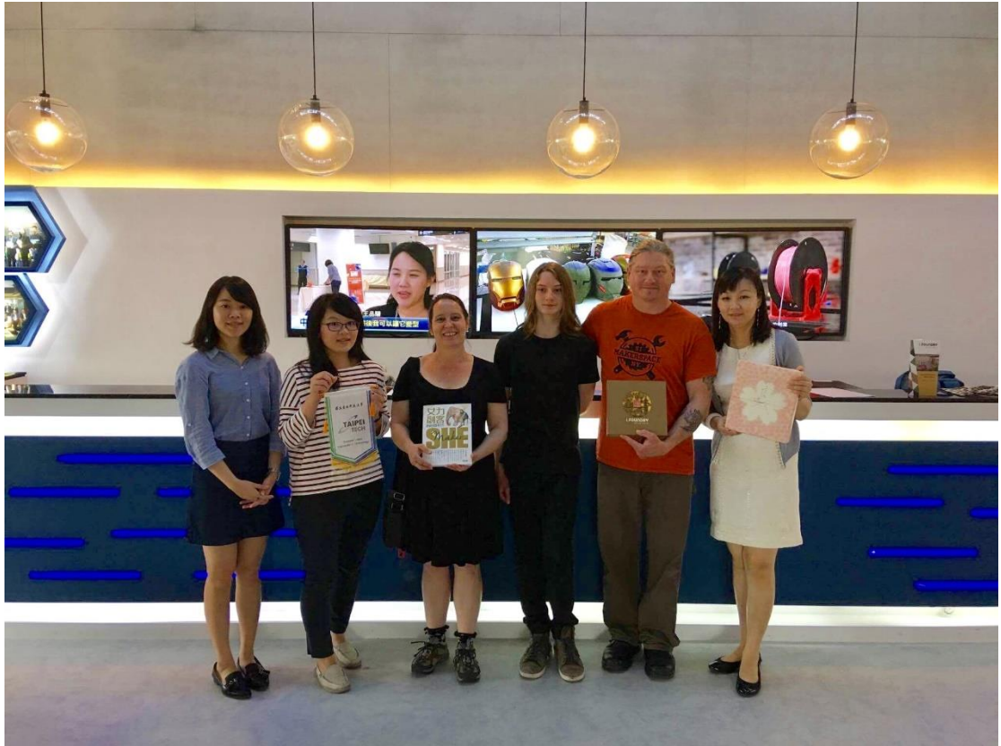
2017年4月曾至「點子工場」參訪，實際體驗360度人像掃描、VR、She Maker等多項研發成果。