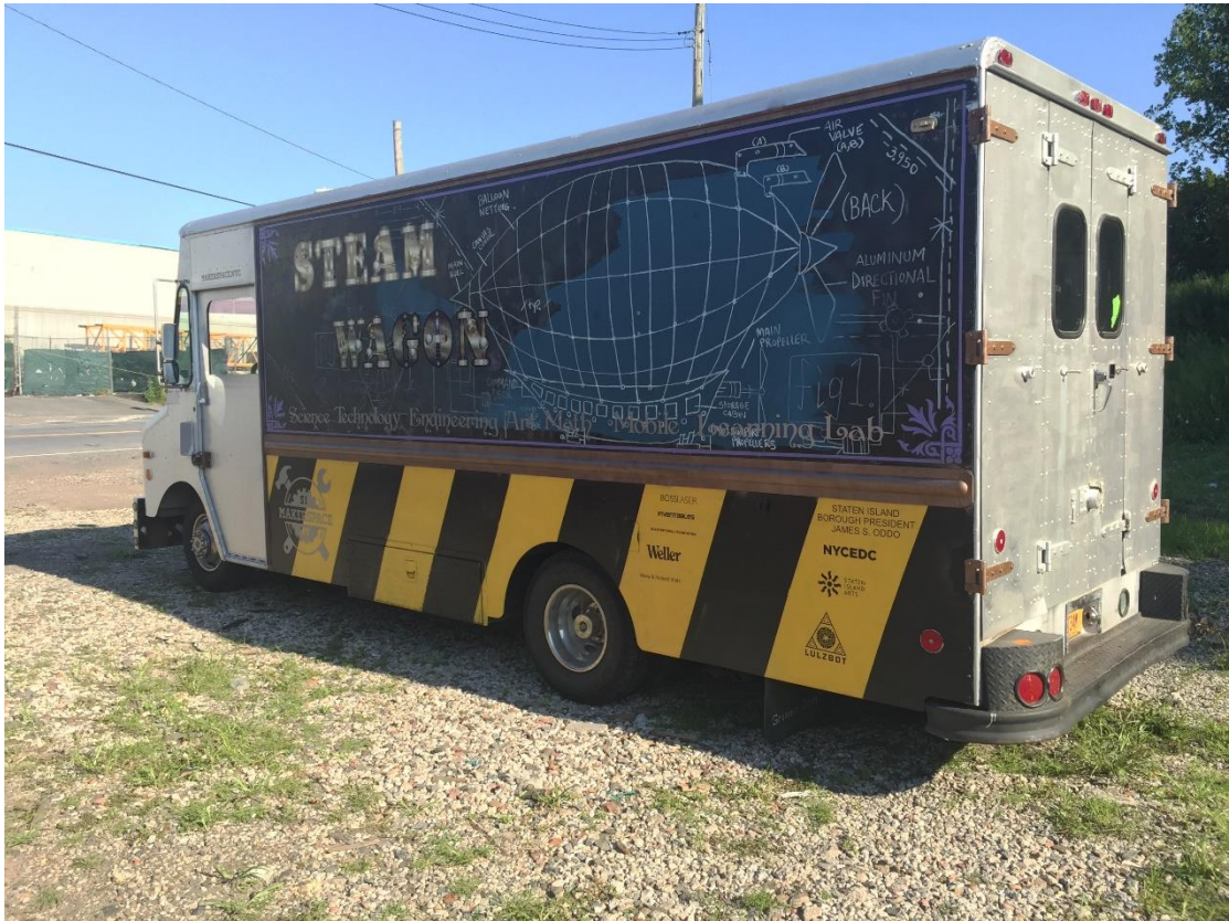
STEAM WAGON 是一台創客行動車，內有 3d 印表機等數位製造工具，巡迴各校推廣。