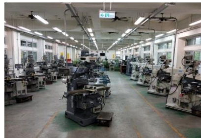
圖 2 傳統銑床實習工廠