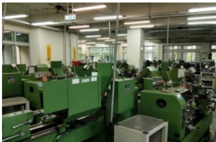
圖 1 傳統車床實習工廠

以技術型高中本校機械科為例：車床有 24 台(圖 1)、銑床有 24 台(圖 2)、磨床有 4 台、鑽床有 4 台和砂輪機 2 台，可容納一個班(37 名)學生上課並且分組由 2 位教師授課。實習工廠規劃成為綜合加工廠即學生在此工廠可以學習車床、銑床、磨床和鑽床等等加工技術，此外向勞動署申請成為合格綜合加工乙、丙級合格檢定工廠，可以提供在校生專案檢定為學生就業做充分準備。