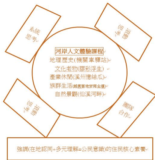
圖 1：溪洲國小地方學學習內涵架構