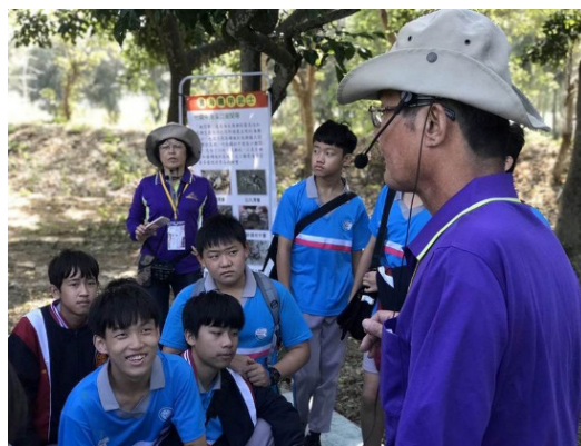
圖 6 社區志工導覽竹南濕地生態與維護工作

經費有著落，交通問題解決，接下來要克服的就是人力資源的部分，對此團隊找到對於在地文史以及自然保育長期耕耘的苗栗縣在地文化推廣協會以、塭內社區發展協會、海科館潮境海洋中心、竹南中港慈裕宮管理委員會、海巡署中部分署第三岸巡隊、海湧工作室等等團隊，共同成為推動課程的夥伴，一起幫助我們讓孩子更加認識自己的家鄉，期待孩子能夠透過認識家鄉理解家鄉進而喜愛這一片孕育自己成長的土地。