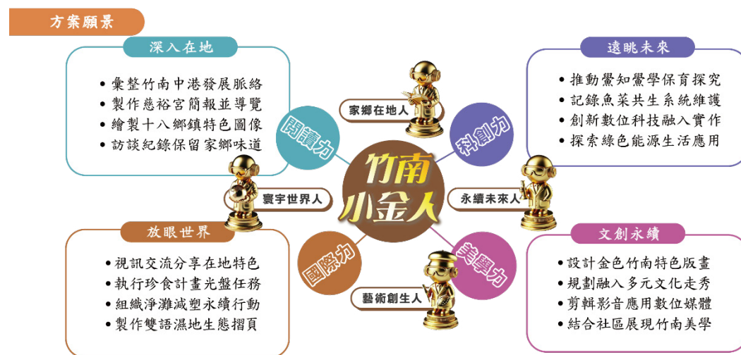
圖 1 「金色竹南 與世界邂逅」課程方案願景

經過了一整年的準備，終於在 108 學年度開始了我們的小金人養成計畫，團隊成員將竹南匯聚多元文化與生命力的特色融入課程，從慈裕宮、竹南濕地、手工金紙等在地特色出發，透過課室學習與踏查實察相互呼應。以「議題探究為經、戶外踏查為緯」統整課程，建構跨域學習並融入 SDGs 與 108 課綱精神，打造兼具在地與國際視野的課程模組，以閱讀力、科創力、美學力、國際力為願景，培養能知鄉愛鄉、行動永續、藝術創生、放眼國際的「竹南小金人」。期待孩子在三年的課程學習後，成功地由 LODG 轉化為『G O L D』竹南小金人！