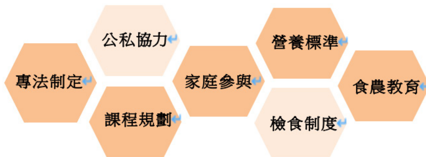
圖 2 學校營養午餐及飲食教育推動策略

學校營養午餐關乎學童健康與基本權，也是國家競爭力基礎。目前我國中小學營養午餐政策面臨法規紛雜、專業人力短缺和飲食教育未能落實深化等問題。本研究主要發現為：(1) 部分先進國家制定學校午餐專法，規範費用、設備、營養標準等事務。(2) 日、韓等國自辦營養午餐比率和校園營養師配置數量均優於我國。(3) 國外的飲食教育除以學生為對象外，更推廣至家庭企業，乃至於各機構。根據上述發現，本研究提出以下三點建議：(1) 制定午餐專法。臺灣中小學營養午餐問題複雜，由中央制定專法，明訂餐費標準、人力配置、管理規範等；針對不同地區、規模的學校，提供不同的營養午餐供應模式與推動原則。同時規定專款專用，弭平城鄉差距。(2) 強化食安管理。建立校園內明確檢食制度。針對不同成長階段學生，訂定的營養攝取建議標準。設立地方委員會，營養午餐事務納入專業人士意見。(3) 深化食農教育。政府飲食教育的推動應落實至社會各階層，公私部門協力推廣食品安全和農業體驗。設計相關飲食教育課程模組，並提供教師必要的協助與訓練。綜上所述，學校營養午餐及飲食教育推動策略，如圖 2 所示。總之，提升飲食教育和學校營養午餐品質，需要國人持續關注與努力！