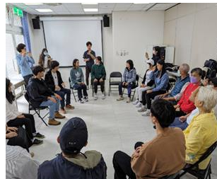
圖 2 原民長者與學生共同討論