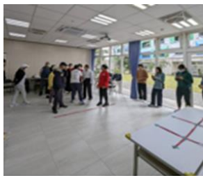
圖 1 原民長者與學生遊戲互動

以議題討論的方式，則是用課前資料的蒐集、閱讀，課中論述、澄清，課後反思、回饋。有了實際與原住民長者互動，師培生對於原民的議題更有參與感，討論起來如同身處於原民部落的熟悉。學生們提到，「長者會穿傳統服飾，樂於分享屬於原住民的記憶與文化，另外也會帶領我們一起去體驗(歌謠、舞蹈)...」；「活動的最後我們一起唱歌時，大家一個個牽起彼此的手開始跳起舞，在那個當下，我彷彿就像他們的家人一樣，融入在部落裡...」（圖 3）。也呼應了文化回應的方式，習得原住民相關文化知識（周惠民，2011）。