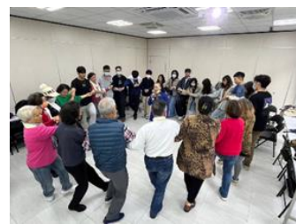
圖 3 原民長者帶領學生共舞