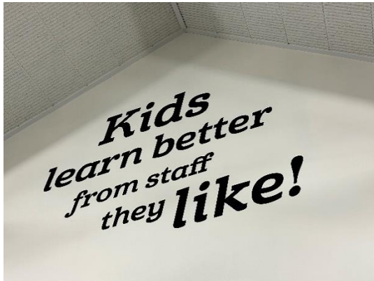
圖 3 佈置在辦公室的名言佳句

臺灣有些中小學也會有類似的情境佈置，不過，較少針對給教師的名言佳句，我想這可能是文化的不同。臺灣若不方便將這些句子佈置在辦公室，也許可以考慮在會議或文件中，融入一些教育類的名言佳句。