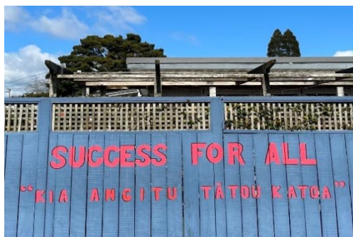
圖 1 校園中的學校遠景 Success for All

反觀臺灣的經驗，臺灣的中小學校園也許在學校建築物上有寫出學校願景，但筆者較少看到學校願景及學校珍視的價值佈置在各教室及辦公室中。另外，臺灣許多學校也推動品德教育，也列出許多學校的品德核心價值，如尊重、負責、關懷...等。但這些核心價值比較抽象，或許可參考這前述做法，使用學生的照片來呈現核心價值的內涵，讓學生可以掌握其內涵。