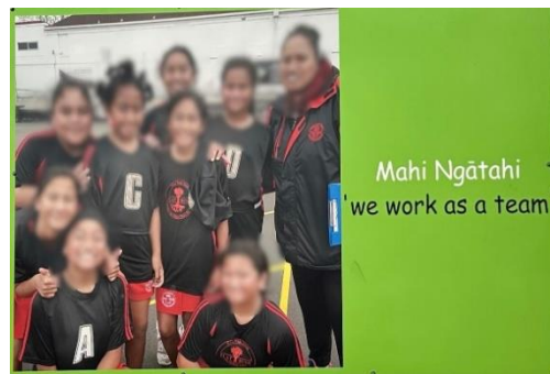
圖 2 以具體的照片解釋抽象的核心價值