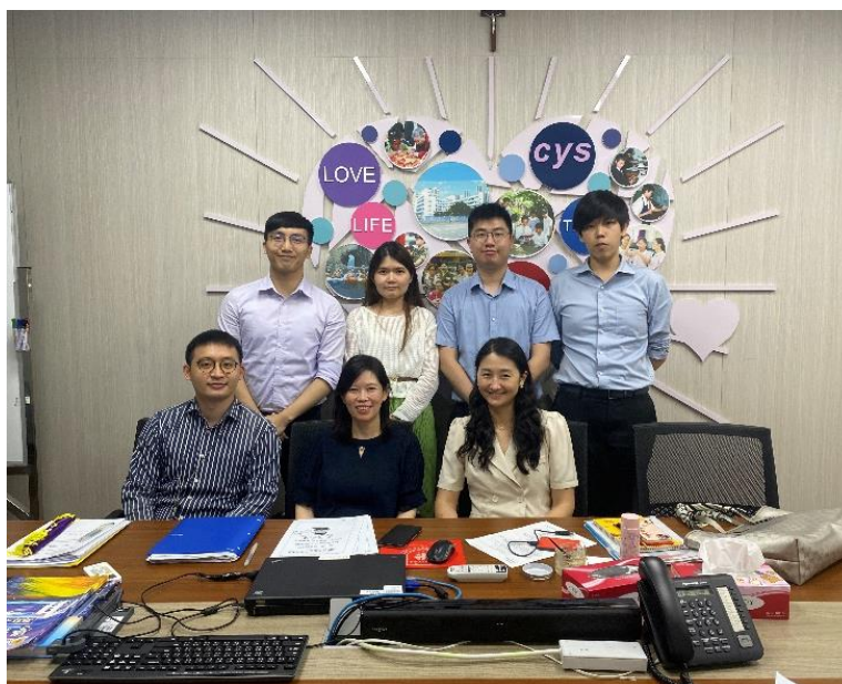
圖 4 共備社群成員議課後合影