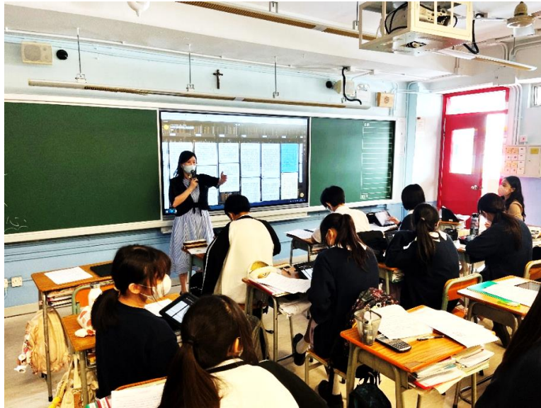
圖 2 筆者正在進行教學演示