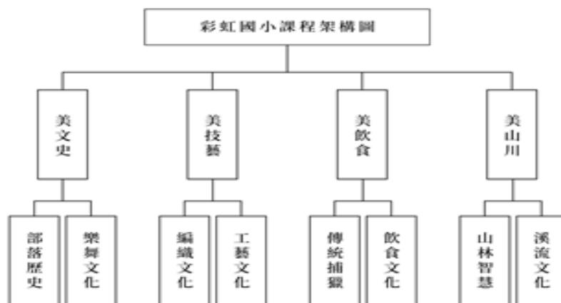
圖 1 彩虹國小校訂課程架構圖

學校主任也繼續指出彩虹國小獲選第一等獎後，學校開始規劃以阿美族為知識體系的校本課程為第二階段方案課，並稱之為「文化新殿堂」課程方案，此時課程架構有美文史、美技藝、美飲食及美山川等四個面向及部落歷史、樂舞文化、編織文化、工藝文化、傳統補獵、飲食文化、山林智慧及溪流文化等八個領域，課程架構如圖 1 所示。