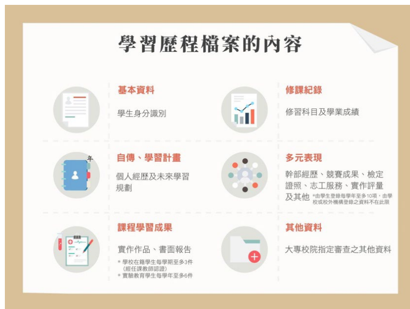
圖 1 學習歷程檔案的內容

學習歷程檔案包含六個項目，分別是：基本資料、修課紀錄、課程學習成果、多元表現、學習歷程自述與其他個別校系指定之資料。