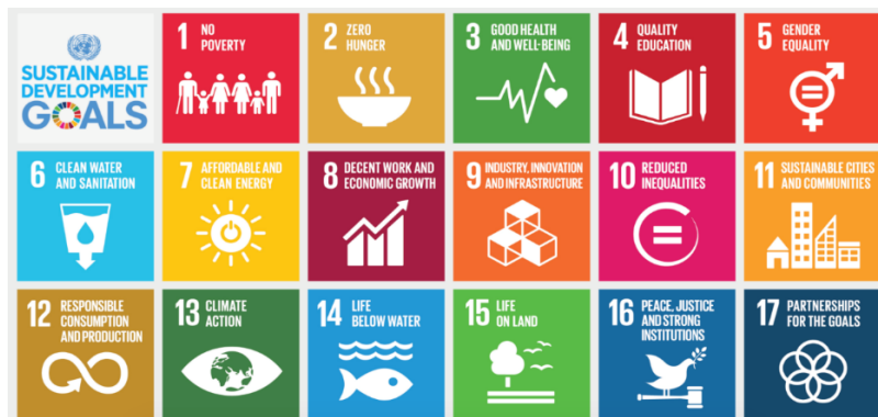
圖 1 Sustainable Development Goals (SDGs)

永續發展目標包括十七個目標，在 2015 年提出，並於次年正式生效，以 2030 年為目標年。其內涵除了延續聯合國千禧年目標「以社會面向的指標為主」，再增添發展及環境面向的指標，而成為全球共同努力的指引。除了社會、發展、及環境的主軸 (共包含了十五個目標) 外，目標 16 的正義與和平及目標 17 的夥伴關係勾畫出整個永續發展目標的執行策略和目標方向 (圖 1)：包容與連結多元文化社群組織的夥伴關係是執行策略，促成國際和平與社會公平正義是目標 (United Nations, General Assembly, 2015)。