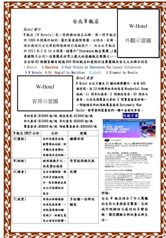
圖 3 學生作品 臺北 W Hotel